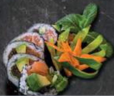
Futomaki 6szt. *