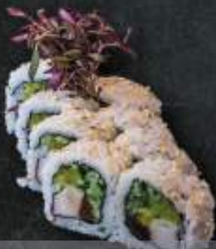
Uramaki 8szt. *